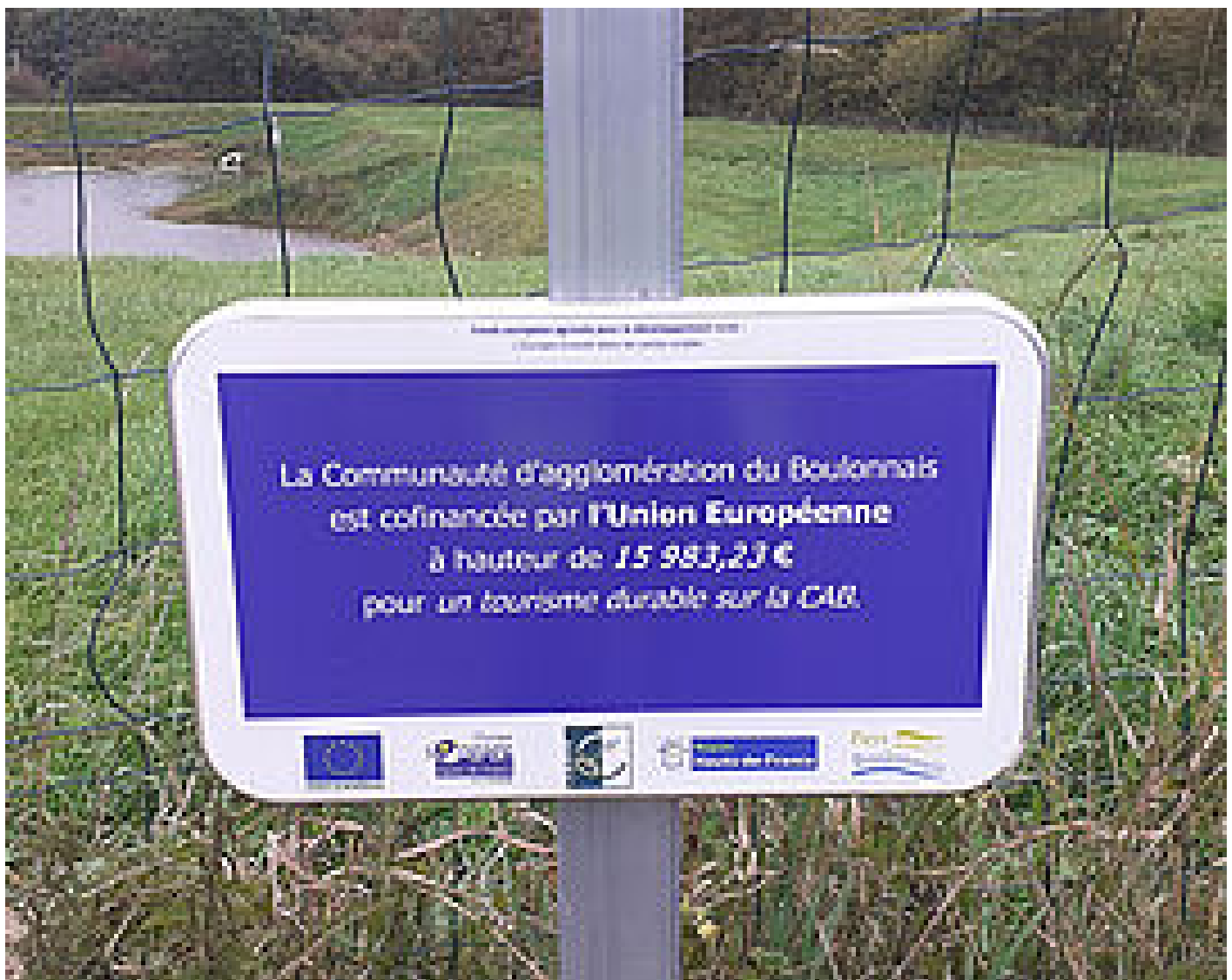
Schéma pour le développement rural et tourisme vert

Un schéma concernant le développement rural et plus particulièrement le tourisme vert a été initié par la CAB avec l'appui des services de l'Agence d'Urbanisme et partagé avec les communes concernées.